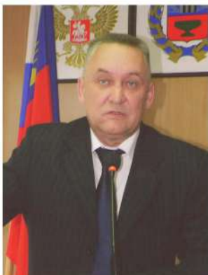
Глава города Славгорода В.А. Кинцель